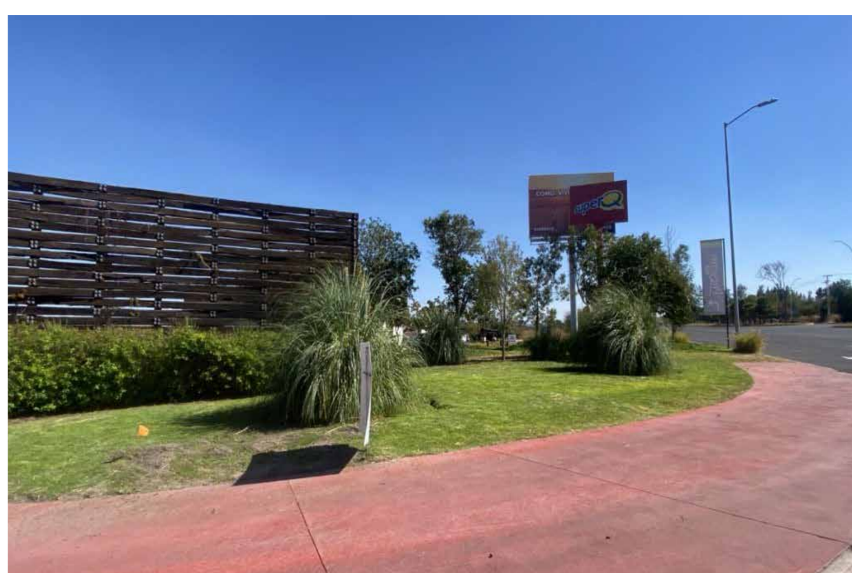
Mantenimiento general de espacios