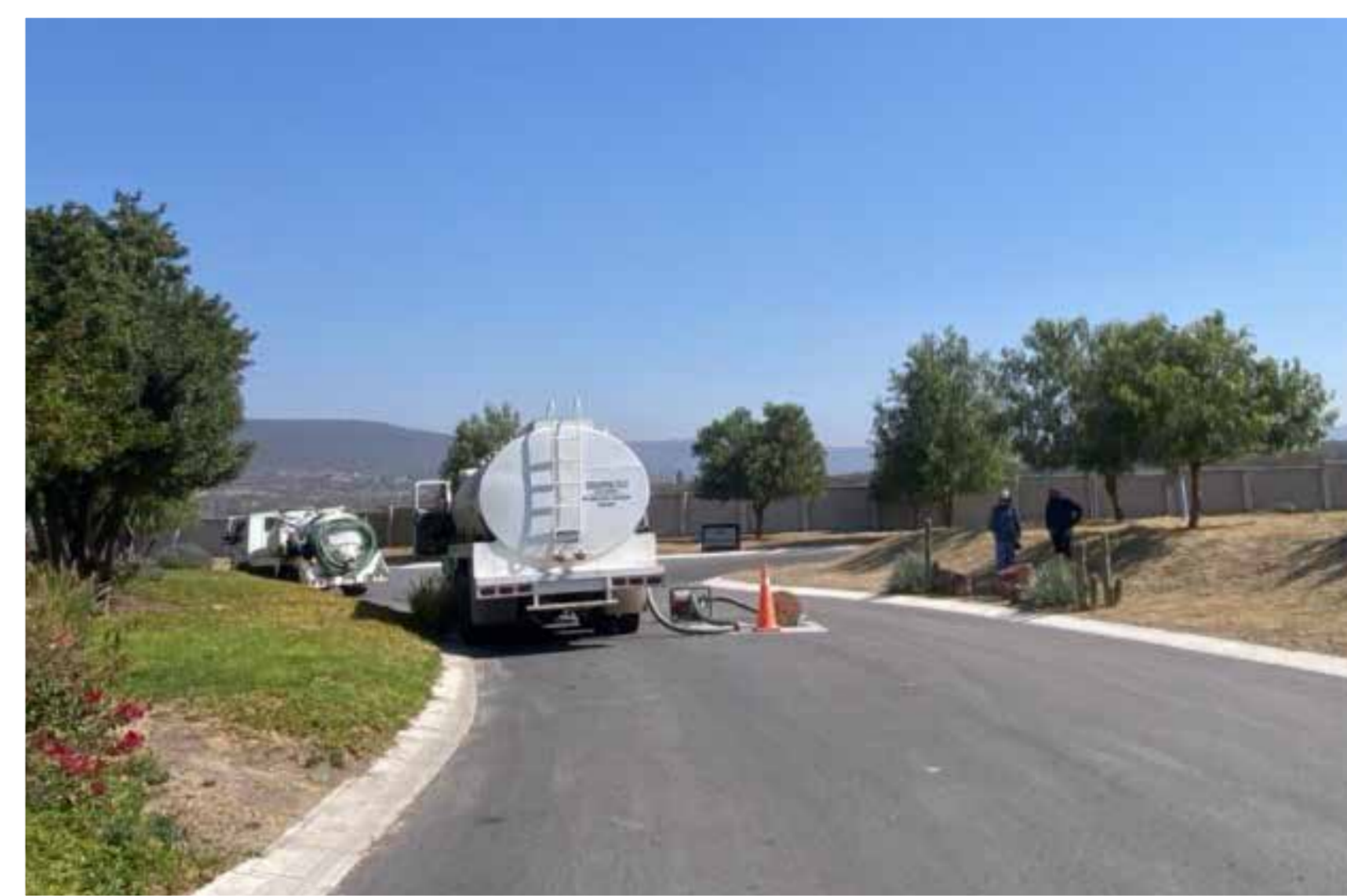
Servicio de desasolvez en red sanitaria y amenidades