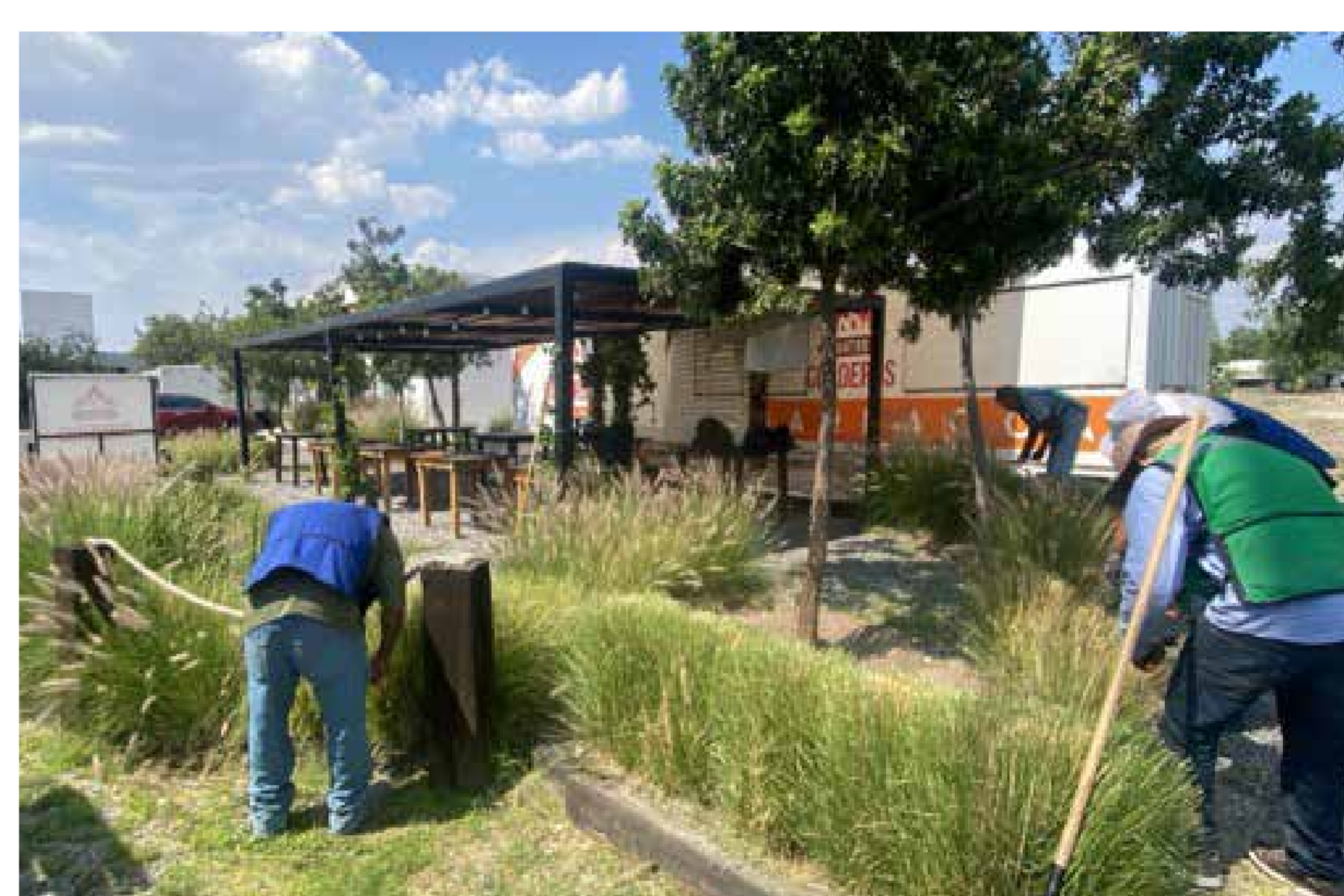
Mantenimiento y cuidado de imagen