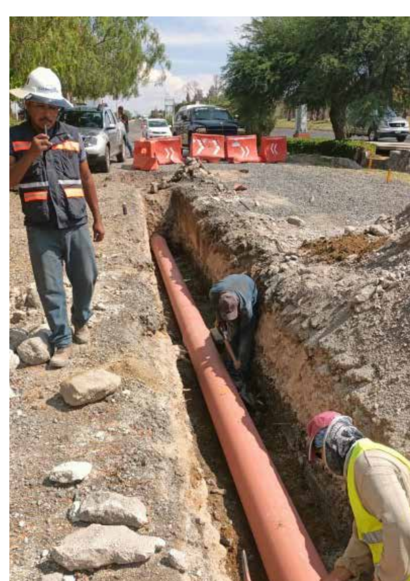
Drenaje sanitario en carril de incorporación