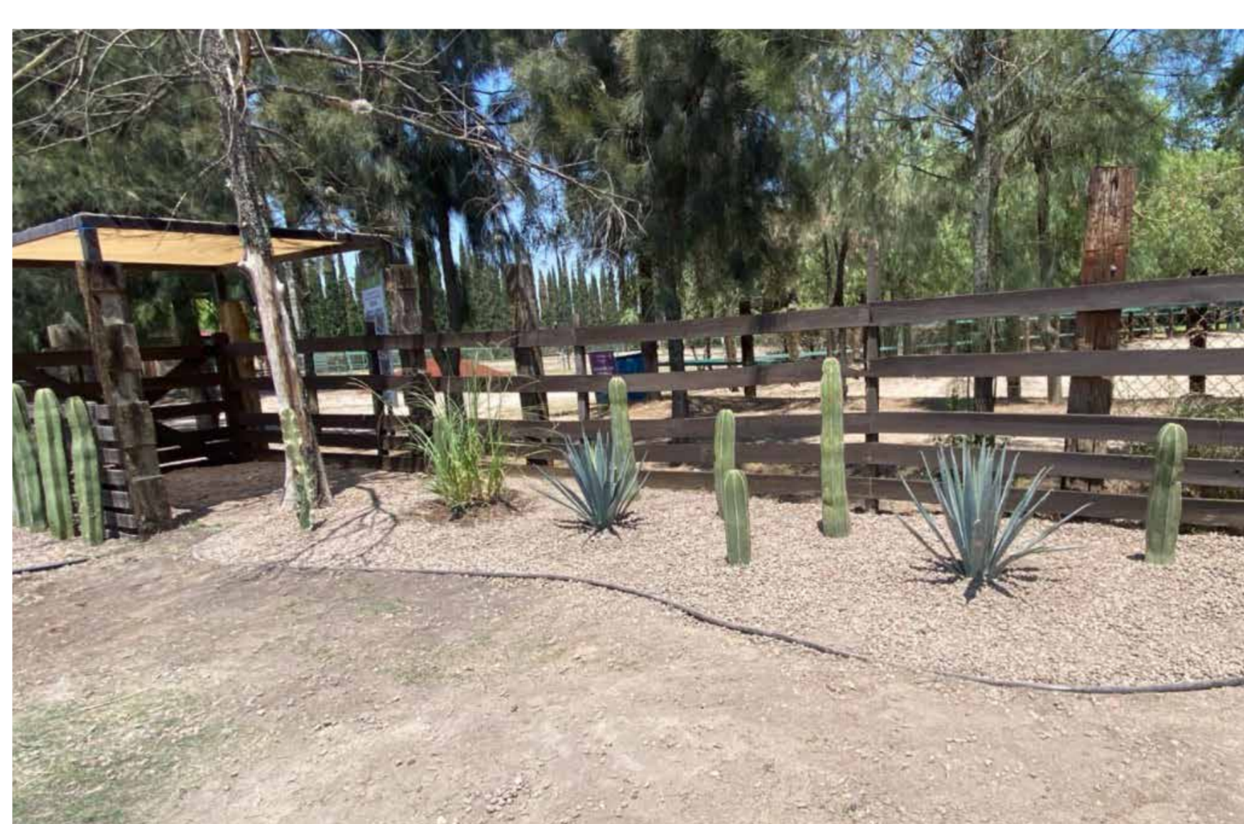
Mantenimiento al acceso Hípico