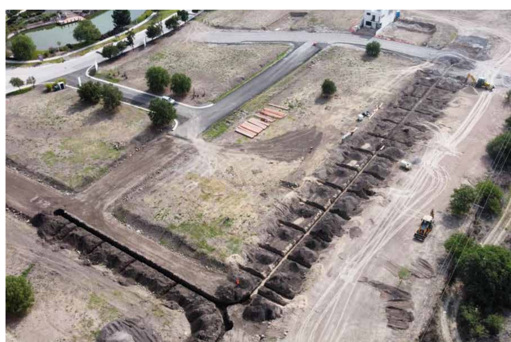
Drenaje sanitario Ciprés