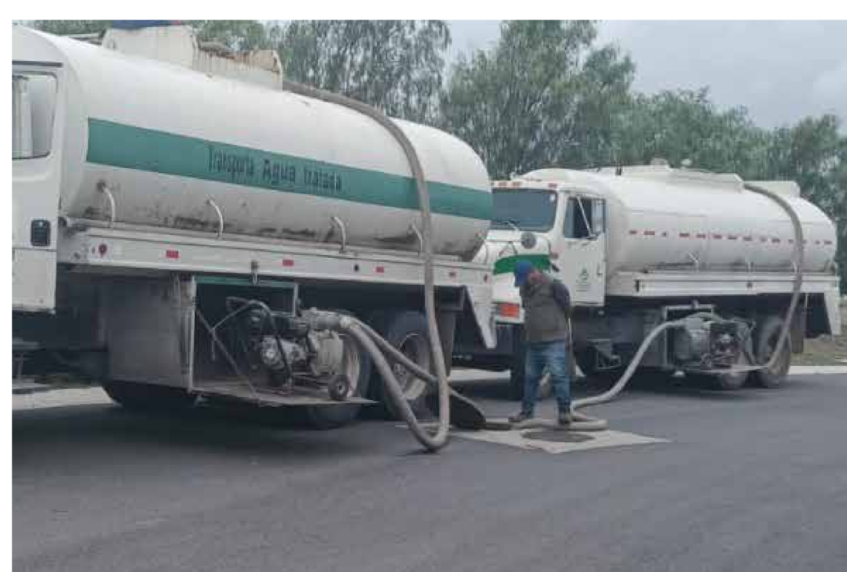
Desazolve de la red sanitaria