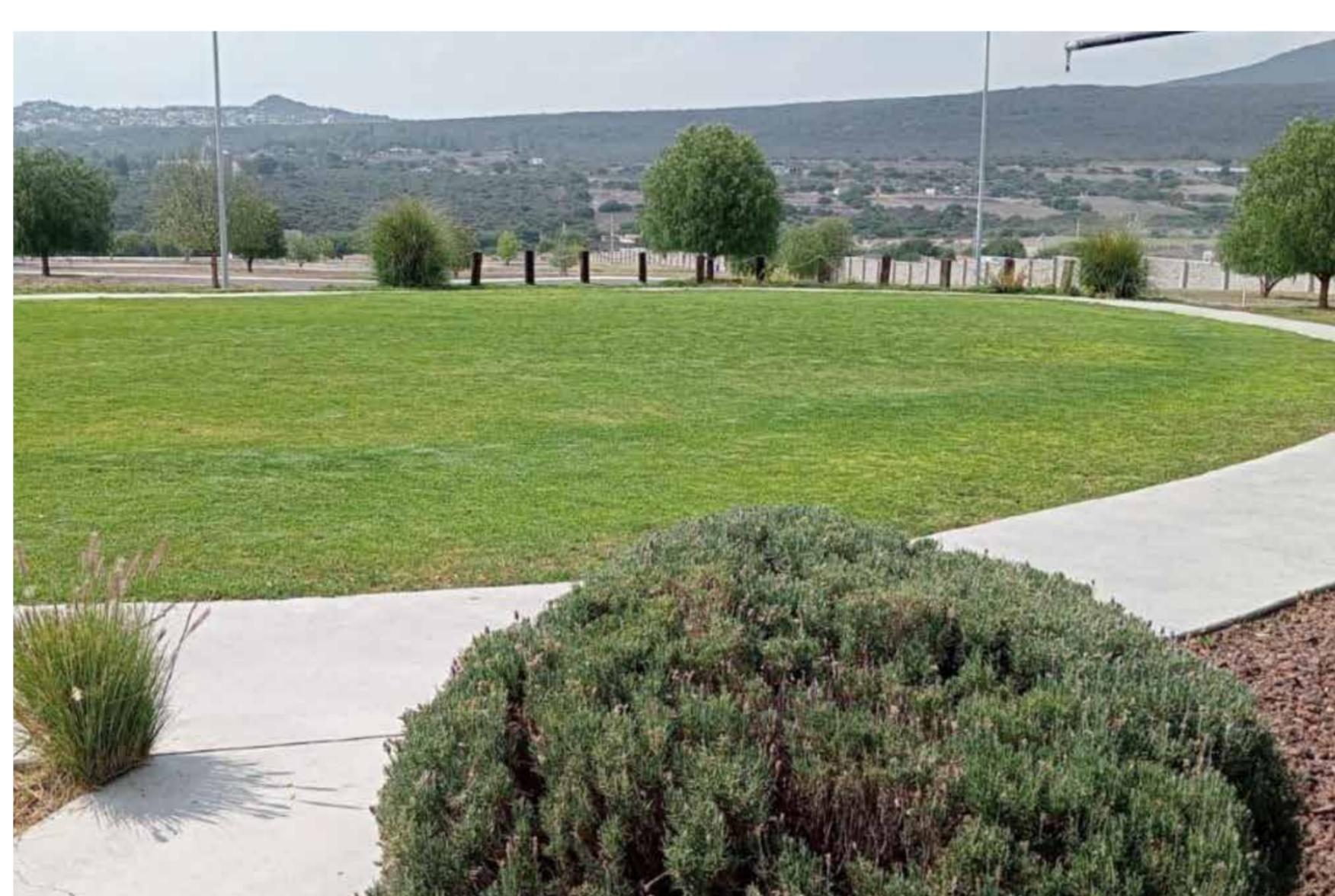
Mantenimiento general de áreas verdes